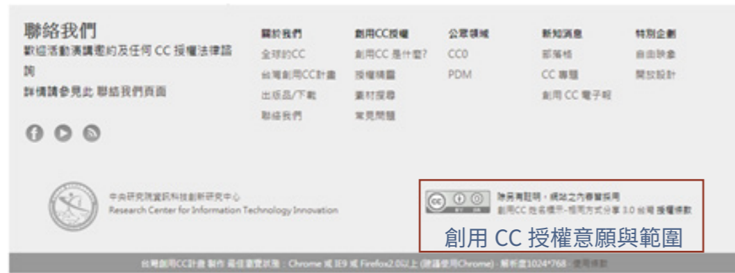
台灣創用 CC 計畫 | Creative Commons Taiwan 網站