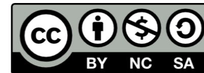
創用 CC 授權條款圖示

以本教材網站 ( http://ile.tp.edu.tw/ ) 為例，在作品完成後採用創用 CC 授權，並以「姓名標示 - 非商業性 - 相同方式分享 3.0 臺灣」授權條款，提供使用者使用本著作。