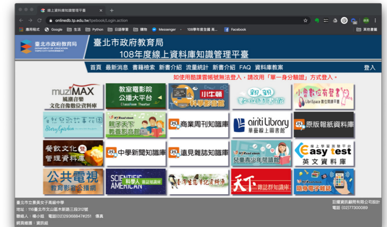
圖：臺北市政府教育局 108 年度線上資料庫

找特定的資料，可以利用專業的，且資料收錄領域相符的線上資料庫來找資料。資料庫指的是：針對某一學科、主題或類型，將其相關的資料，以特定的方式有系統地將這些大量、複雜且多樣的資料加以收集、整理、儲存，以提供使用者作查詢。資料庫種類繁多，如：文學性的詩詞資料庫、自然科學類的昆蟲圖鑑、新聞性的時事資料、歷史資料庫、美術資料庫，還有期刊論文、百科全書、學位論文等，利用資料庫蒐集資料，內容豐富品質好喔。