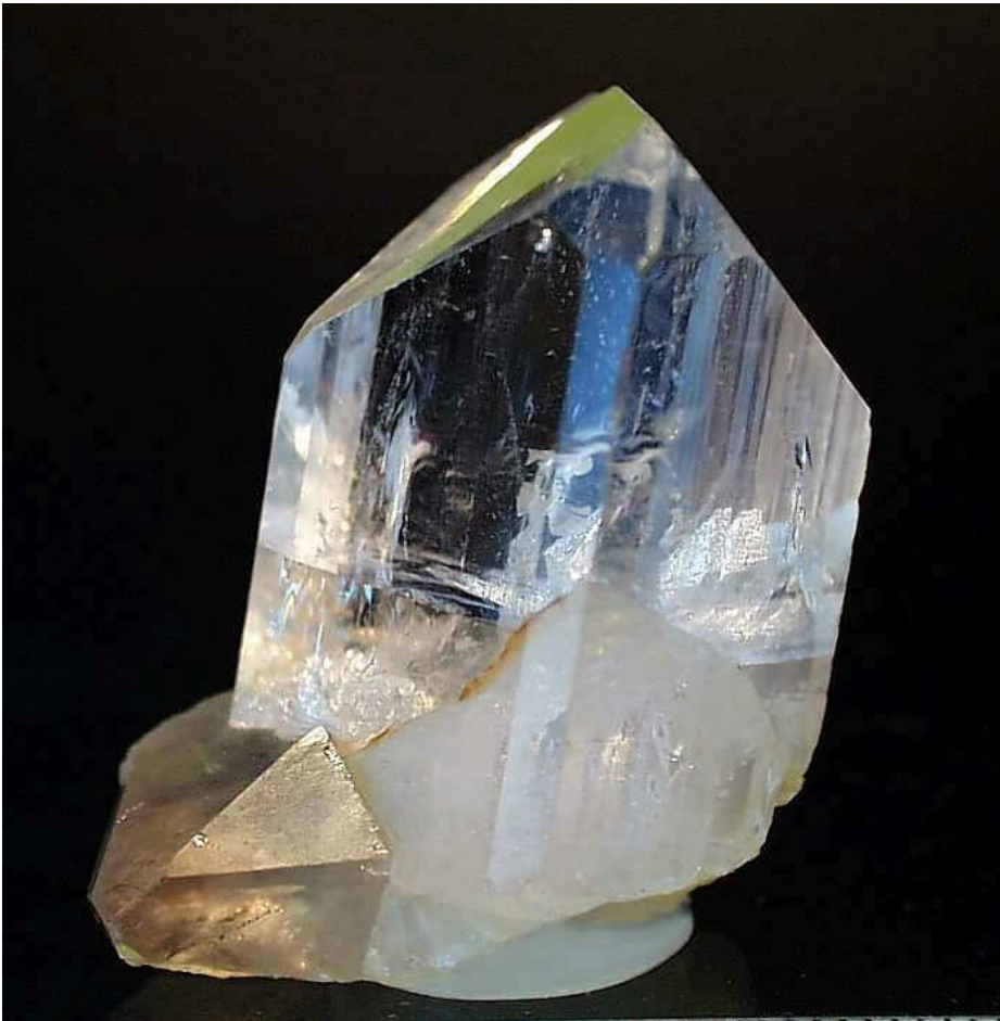
Sibnite 輝銻礦 Calcite.jpg