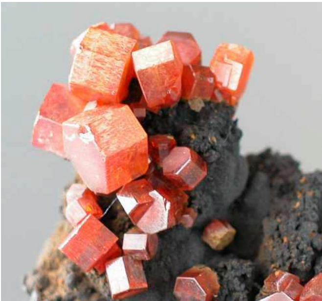
Topaz \text{Al}_2\text{SiO}_4(\text{F},\text{OH})_2 黃玉(晶) 斜方.jpg